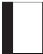
②シングルシャドウ