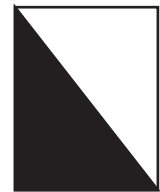
⑤シャープシャドウ